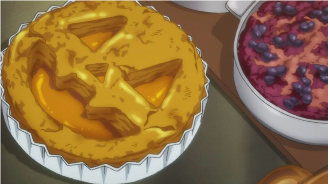
Anime: Banana Fish Autor: Akimi Yoshida