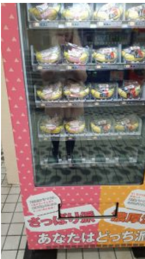
Bananenautomat eines Frücteshops in Shibuya XD