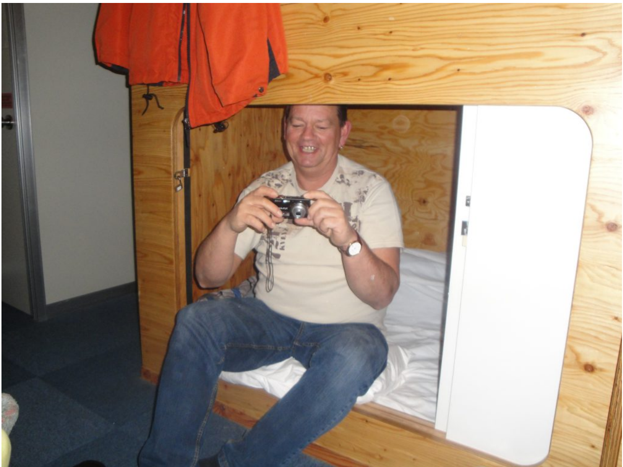
Mein Vater fand es am Anfang noch lustig :D.

prüfen. Die Unterschiede können riesig sein! Hostel ist also nicht gleich Hostel. Z.B. war ich in einem Hostel in Tokyo und zu Gast waren auch meine Eltern. Ich dachte: Günstig und gut! Hauptsache übernachten und alle im selben Zimmer. Ja.. so kann man denken :D. Das Hostel war erst mal richtig schwierig zu finden, trotz Karte und Adresse. Nachdem wir es dann gefunden hatten und unser „Zimmer“ gesehen hatten ist die erste Euphorie verschwunden. Die Zimmer waren einfach eingerichtet, das ist auf jeden Fall ok, ABER an den Betten gab es Holzschiebetüren, die man abschließen konnte. Generell eine gute Idee um seinen Kram vor anderen zu schützen, wenn man mit fremden übernachtet. Aber auch ein bisschen Knastfeeling. ^^° Nun gut, wir haben das Beste daraus gemacht. Die Küche vom Hostel war nicht sehr sauber und allgemein der Wohlfühlfaktor nicht sehr hoch.