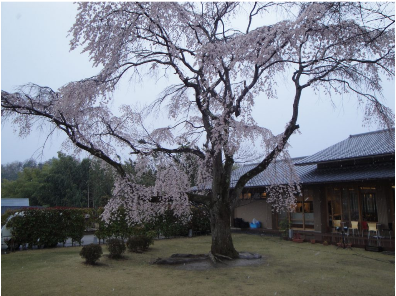
Kyoto Utano Youth Hostel

viel Licht und einen weiten Blick in den schönen Innengarten oder Vorgarten. Die Zimmer sind einfach aber praktisch eingerichtet und es gibt sowohl Duschen, als auch! Ein Ofuro – also ein traditionelles japanisches Bad. Sowohl für Frauen, als auch für Herren. Dabei können die Fenster geöffnet werden, sodass ein Blick auf die oberen Blätter und Bäume frei wird. Zudem gibt es in diesem Hostel auch 4 Doppelzimmer mit eigenem kleinem Bad und Fernseher. Auch tolle Menüs von 2 Köchen kann man sich jeden Abend kaufen und es gibt ein Frühstücksbuffet.