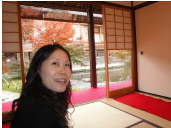
Meine japanische Mama im Ryokan mit mir ^-^

Wer sich etwas Geld beiseitegelegt hat, der sollte unbedingt mal in Japan ein Ryokan besuchen. Das ist ein traditionelles, japanisches Gasthaus. Meistens ist der komplette Stil auch traditionell japanische. Das bedeutet ihr bekommt ein Tatamimatten Zimmer, Futon anstatt von Bett und traditionelle Schlafyukata gestellt. Außerdem gibt es im Ryokan oft ein Onsen, in dem ihr heiß baden und euch entspannen könnt. Manchmal ist im Zimmerpreis auch das Essen schon mit drin. Dies ist besonders bei sehr teuren Ryokan der Fall. Dann gibt es traditionelle japanische Speisen, die ihr auf dem Boden verspeist. Ich finde ja, dass ein Besuch im Ryokan ein tolles Erlebnis ist. Wer sich nicht die ganze Urlaubszeit eines buchen kann, könnte auch nur eine Nacht mal in einem schlafen, um es zu erleben.